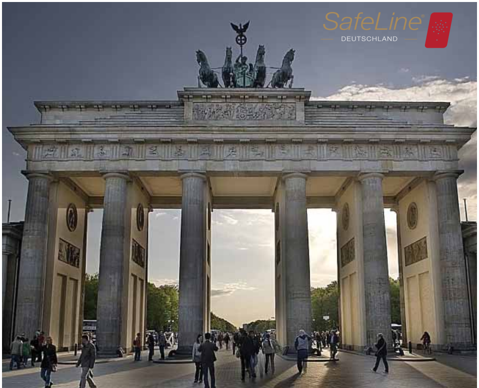
Der Hauptsitz von SafeLine-Deutschland befindet sich in Wipperfürth, Deutschland