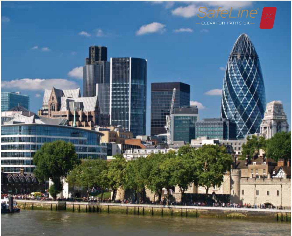
SafeLine Elevator Parts hat seinen Sitz in der Nähe von London, UK