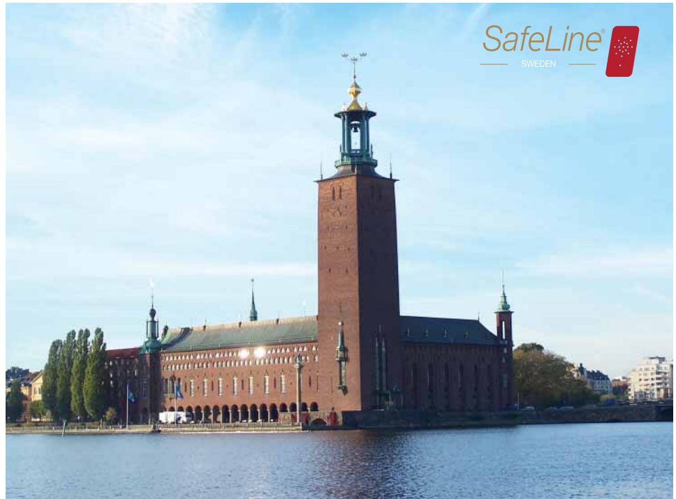
Der SafeLine Hauptsitz befindet sich in Tyresö südöstlich von Stockholm, Schweden