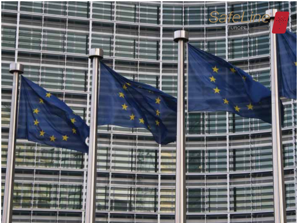
Der Hauptsitz von SafeLine Europe befindet sich in Brüssel, Belgien